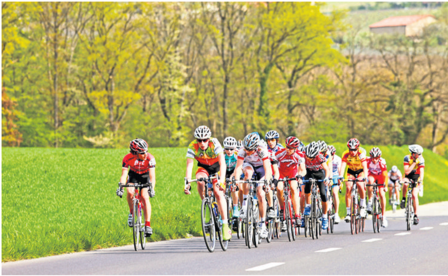
Le GP de Lancy reste fidèle aux routes genevoises, désertées par de nombreuses courses. GEORGES CABRERA